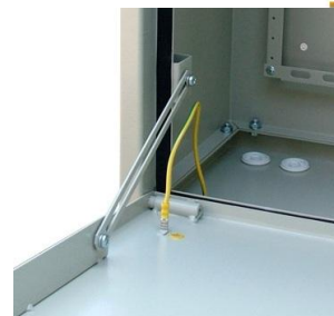
Рисунок 3: Дверные петли

AESP, Inc. 16295 NW 13th Ave - A Miami, Florida 33169, Phone: +1 (305) 944-7710 Fax: +1 (305) 949-4483 www.aesp.com www.signamax.com