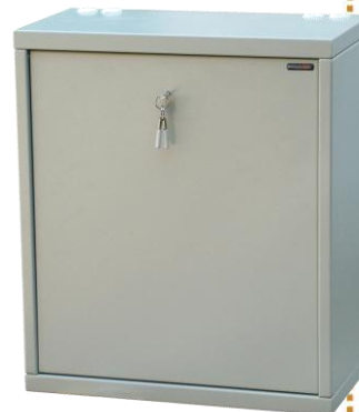
Рисунок 1: Внешний вид RECW-043AV

Соблюдение технологии подготовки и окраски металла, а также использование эпоксиполимерного композита придает шкафу устойчивость к коррозии и воздействию экстремальных температур.